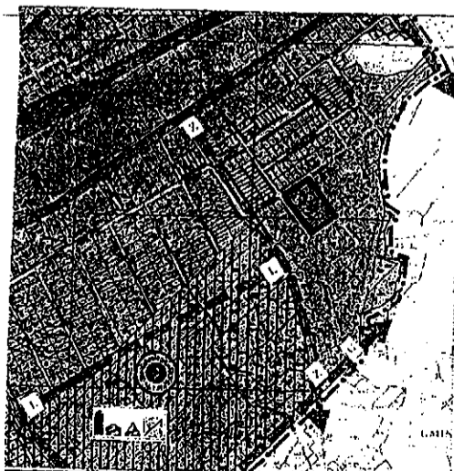
OBSZAR OBJĘTY ZMIANĄ MIEJSCOWEGO PLANU ZAGOSPODAROWANIA PRZESTRZENNEGO

OPRACOWAŁ MIEJSKI ZESPÓŁ URBANISTYCZNY W ŻYRARDOWIE DYREKTOR ZESPÓŁU mgr inż. arch. Małgorzata Walczak Uprawnienia urbanistyczne nr 1479/96 izb.urb.Wa.222